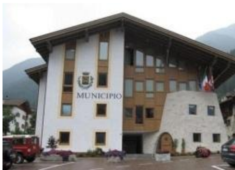
Municipio di Strembo