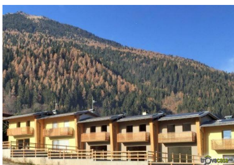
Complesso Residenziale "Carbon Free"