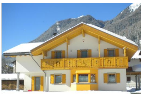
Edificio Monofamiliare classe A+