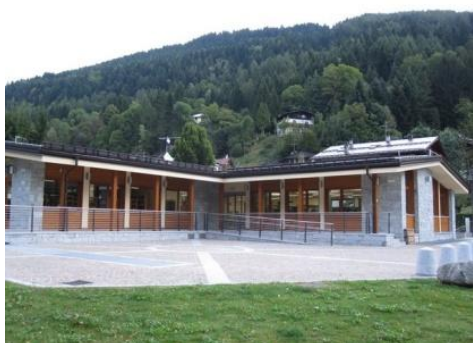
Biblioteca Municipale di Pinzolo